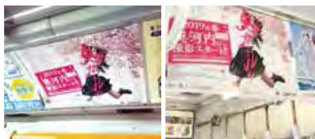
南海バス車内広告