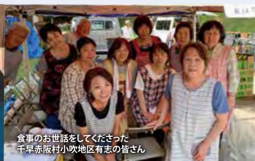
食事のお世話をしてくださった 千早赤阪村小吹地区有志の皆さん