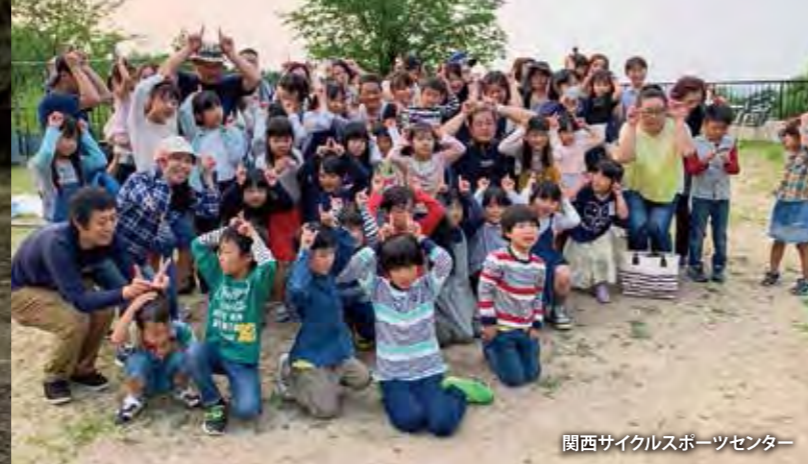
関西サイクルスポーツセンター