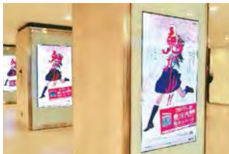
南海なんば駅 高島屋前デジタルサイネージ

瀧川監督を講師を迎え、奥河内や映画の魅力を短編映画を通じて学ぶプロジェクトです。