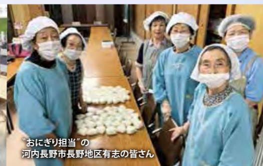
“おにぎり担当”の 河内長野市長野地区有志の皆さん