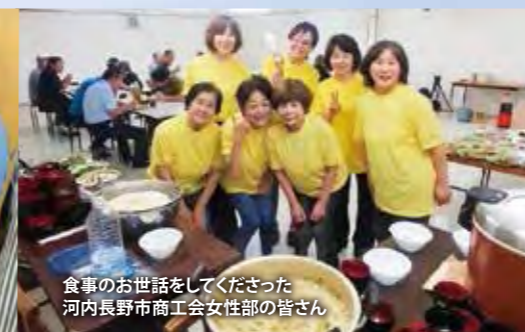
食事のお世話をしてくださった 河内長野市商工会女性部の皆さん